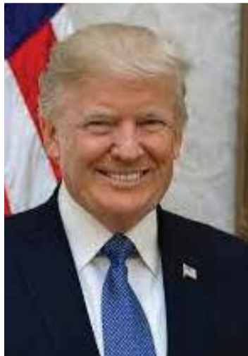
טראמפ.