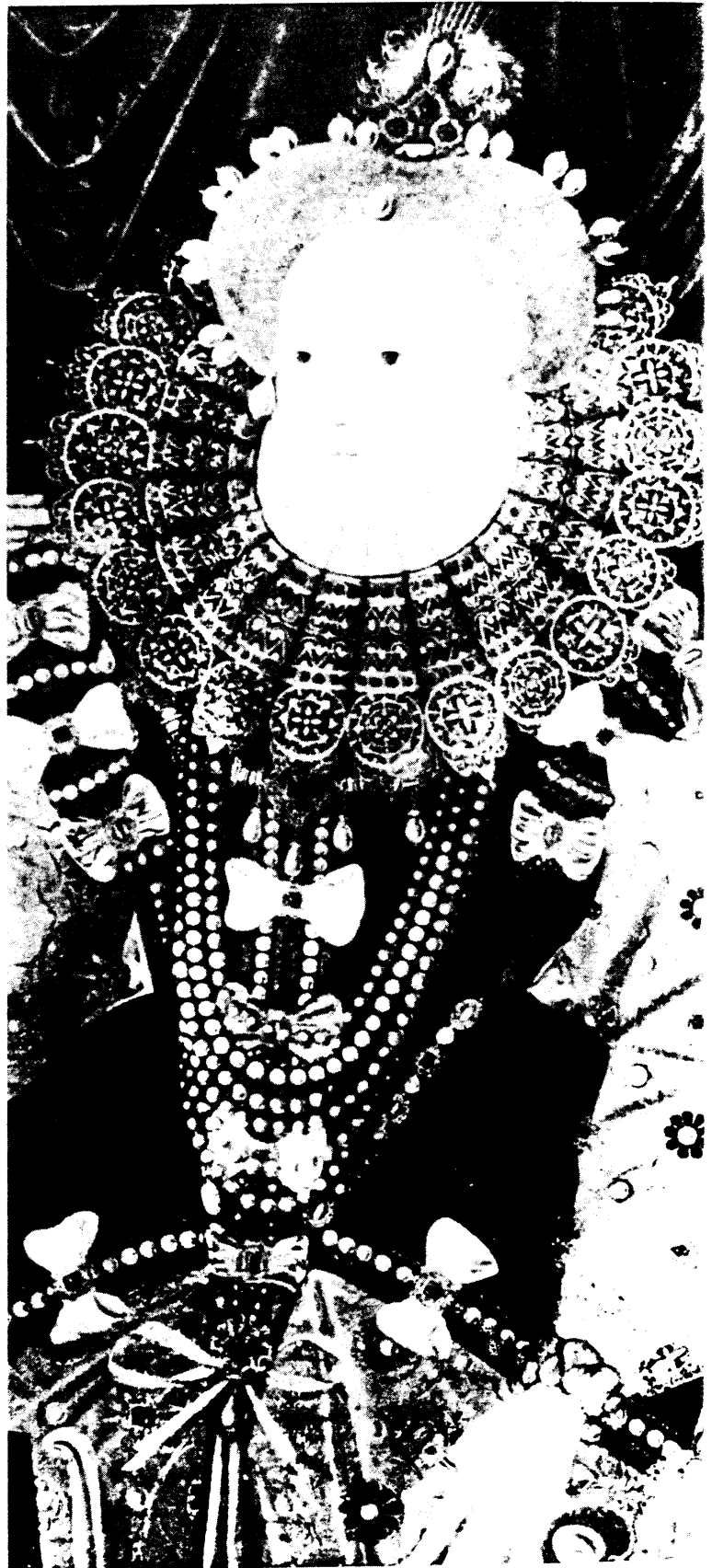
אליזבת הראשונה, מלכת אנגליה. "ישו שלח את אליזבת רבת החסד למלוך עלינו בתרועה הראשונה של השופר השביעי." המאורעות שהתרחשו בתקופת אליזבת נחשבו אות לתהליך הגאולה בהיסטוריה של הישועה.

הנימוק למסגרת אלוהית זו של המאורעות הסתמך לא רק על חזון יוחנן, אלא גם על ספר דניאל. ברייטמן, כבראשון לפניו, מיזג כתבים יהודיים נבואיים בתוכנית האפוקליפטית של היסטוריית הישועה. אך כדי לעשות זאת היה עליו להראות שנבואות דניאל נוגעות לא רק לעבר, או לתקופה שקדמה להולדת ישו, כפי שחשב בראשון, אלא לכלל ההיסטוריה של היהודים בעבר, בהווה ובעתיד. לפיכך, בה בשעה שבראשון תיארו את האפוקליפסה כגרסה לא יהודית של דניאל, חשב ברייטמן שספר דניאל הוא גרסה יהודית של האפוקליפסה, החובקת את כל ההיסטוריה של היהודים עד התגלותו השנייה של ישו. וכך, מאחר שברייטמן התייחס אל היהודים כאל עם ממשי, וכיוון שהציב את האומה היהודית בתחומי ההיסטוריה הקדושה של הישועה, הוא העניק ליהודים תפקיד חשוב כאמצעי גאולה היסטורי ממשי בהיסטוריה של הישועה האלוהית.