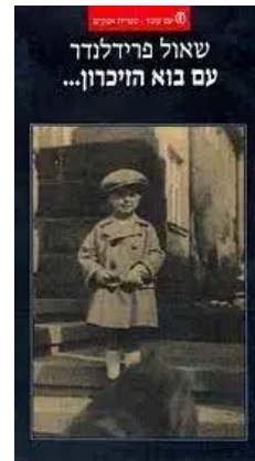
עטיפת המהדורה העברית של "עם בוא הזיכרון" ספרו האוטוביוגרפי של שאול פרידלנדר