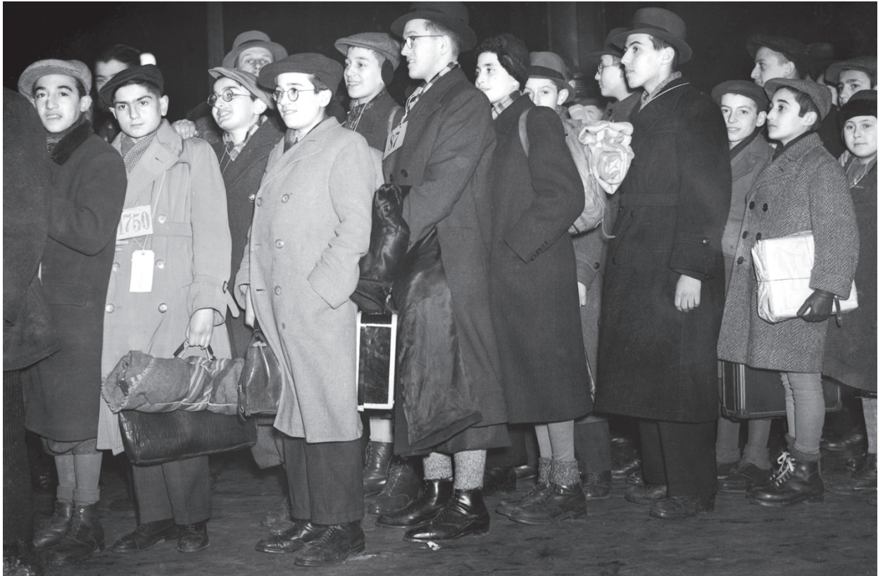
פליטים יהודים מאוסטריה מגיעים ללונדון, דצמבר 1938

ההיסטוריונים אף הוא רציונליזם מעוות. מה שברלין כינה בשם "רציונליזם מטאפיסי" כולל בחובו את מה שפופר כינה "היסטוריונים לא טבעי"; ומה שברלין כינה בשם "ערפול מדעי" כולל בחובו את מה שפופר כינה בשם "היסטוריונים פרו-נטורליסטי".