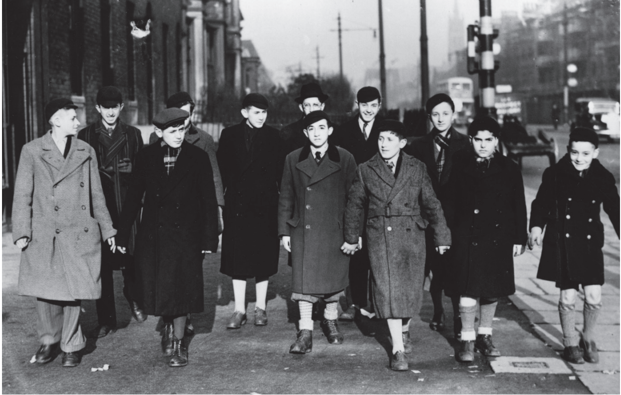
ילדים ובני-נוער יהודים פליטים מאוסטריה בלונדון, ינואר 1939

הסובייקטיבית שלנו את האובייקטים הפיסיקליים), "עולם 3" כולל את הקביעות וההכללות שלנו על "עולם 1" כפי שהן מתווכות דרך "עולם 2". אנחנו חווים את "עולם 1" כ"עולם 2" ועושים תאוריה שלו כ"עולם 3". ולדעת פופר, למרות שהאובייקטים (תאוריות, השערות, אידאולוגיות, פרשנויות ועוד) הנמצאים ב"עולם 3" אינם מציאותיים כמו שולחנות וכיסאות השוכנים ב"עולם 1", הם בכל זאת אמיתיים עד מאוד בדרך כלשהי. האובייקטים של "עולם 3" (התאוריות שלנו וכדומה) הם מציאותיים דקים להשפיע במידה רבה על מה שקורה ב"עולם 1" ו"עולם 2". בקיצור, לתאוריות, אידאולוגיות ופרשנויות, יש תוצאות ממשיות, לרבות תוצאות פוליטיות. לרעיונות יש השפעה, והם משפיעים מבחינה פוליטית לטוב או לרע. לרעיונות של אפלטון, הגל ומרקס, הייתה בעיקר השפעה רעה, בייחוד במאה העשרים, ועל כן צריך היה להילחם בהם בתוקף וללא כל חמלה. או במילים של פופר עצמו: "אני רואה את עולם 3 בעיקר כתוצר של המוח האנושי. אנחנו בוראים את האובייקטים של עולם 3. העובדה שלאובייקטים אלה יש חוקים אוטונומיים משל עצמם, המביאים לתוצאות בלתי-מכוונות ובלתי-צפויות, היא רק דוגמה (מעניינת מאוד כשלעצמה) לכלל מקיף יותר, הכלל שלכל הפעולות שלנו יש תוצאות". בדרך זו התאוריות שלנו (לרבות הפרשנויות שלנו), בדומה לילדים שלנו, "הופכות במידה רבה לעצמאיות מהיוצרים שלהן".