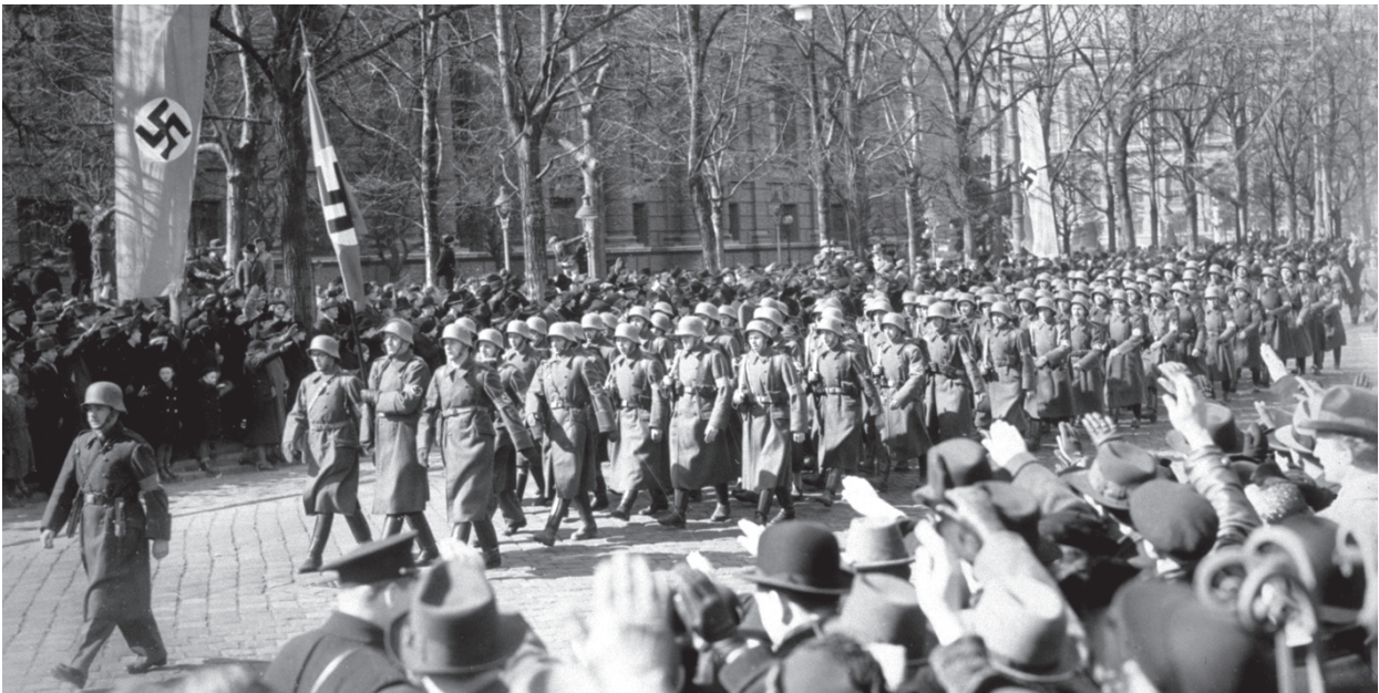
למעלה: היטלר נכנס לווינה ב־13 במרס 1938; למטה: הצבא הנאצי מתקבל בתרועות על־ידי ההמון בווינה, 13 במרס 1938

עצמה היא בחירה מניה וביה. הן היסטוריציסטים נאיביים והן קוראים נאיביים אינם מבינים, כי הם מפרשים מנקודת מבט מסוימת. אילו היו מתוחכמים יותר, היו מודים, שנקודת מבטם היא רק אפשרות אחת מני רבות, ואפילו אם נבקש לקרוא לפרשנויותיהם תאוריות, עלינו לשלול את האפשרות שהן תאוריות הניתנות לאימות. מכאן, בניגוד להשערות המדעיות הטובות ביותר שלנו, שהן אובייקטיביות וודאיות כל עוד הן ניתנות לאימות ולהפרכה, פרשנויות טקסטואליות והיסטוריות הן בהכרח לא־ודאיות וסובייקטיביות. יתר על כן, במיוחד לגבי פרשנויות היסטוריות, פופר טוען, ש"ניתן להתייחס בצדק לתאוריות היסטוריות בלתי־ניתנות לאימות כמעגליות, באותו מובן שהטיחו טענה זו בצורה